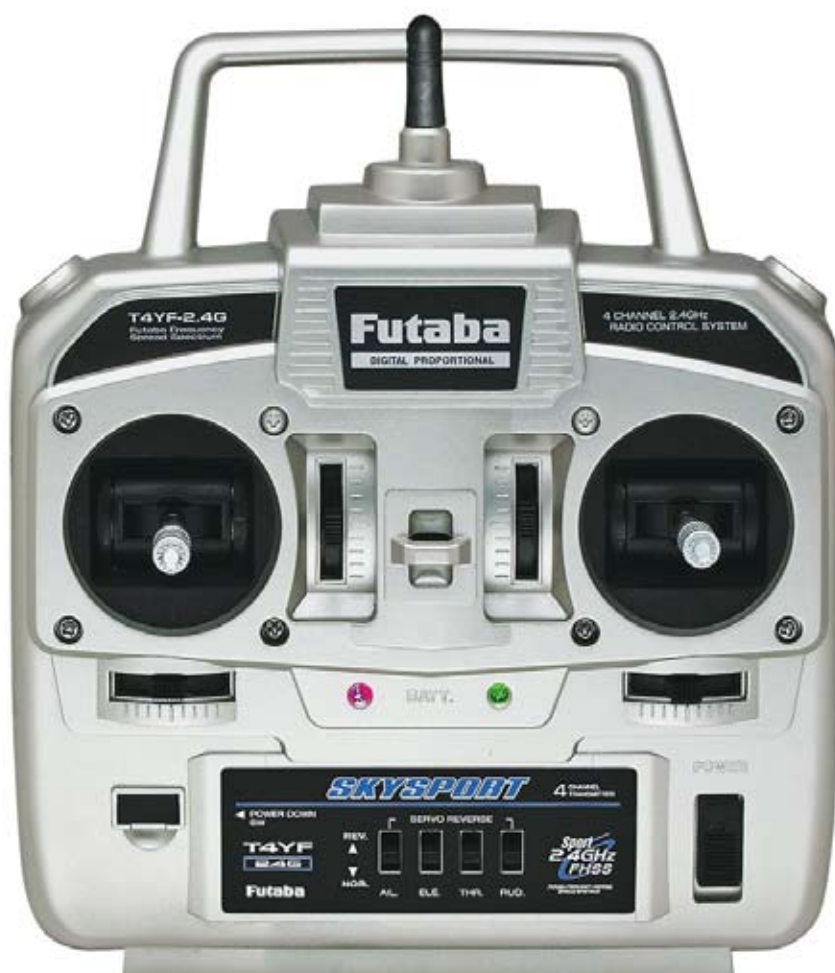
Módulo FHSS1-24G 2.4GHz