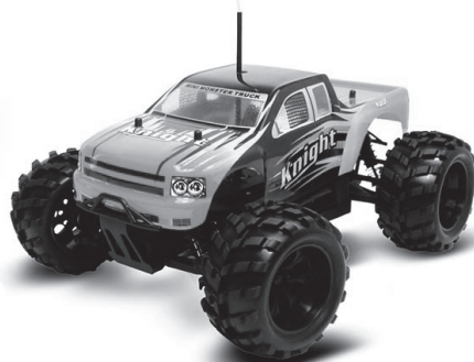
CTW TPET-1806 Monster Truck 4WD Elétrico - 1/18