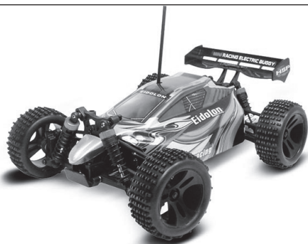
CTW TPET-1805 Buggy Off-Road RC 4WD Elétrico - 1/18