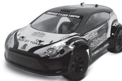
CTW TPER-1808 Rally Car RC Elétrico - 1/18